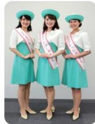
16代目フレッシュメイト