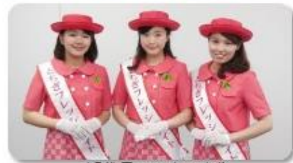
15代目フレッシュメイト

○ 彼女たちが投稿しているフレッシュメイトブログ http://www.tochigi-freshmate.net/ をご覧になるとその活動がわかりますので、アクセスしてみてください。