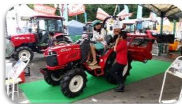
フレッシュメイト トラクターに試乗