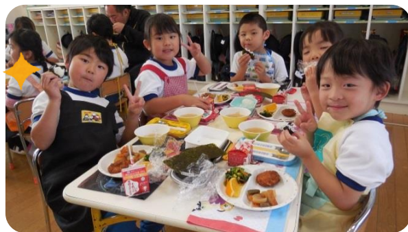
学校法人石嶋教育会認定すずめこども園の園児たち