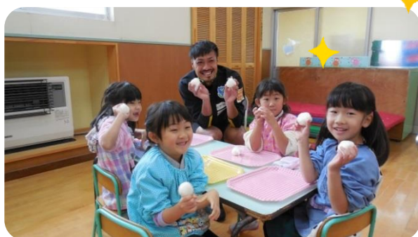
ひかり幼稚園 栃木SC管選手