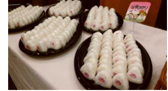
「なすひかり」おにぎり