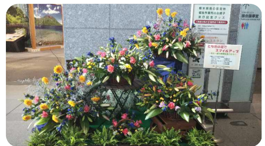
(県庁本館への花飾り)