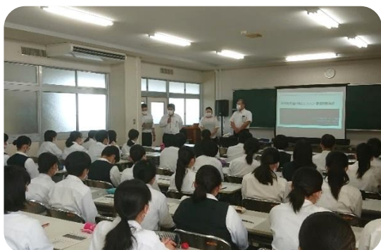
那須拓陽高等学校食品化学科3年1組の生徒に授業を行いました

授業後の感想として、「栃木県産の農産物がここまで海外に浸透していることに驚いた」「食文化や考え方の違いによって売り方を変えることを学んだ」など、農産物輸出に関する理解が進んだようです。