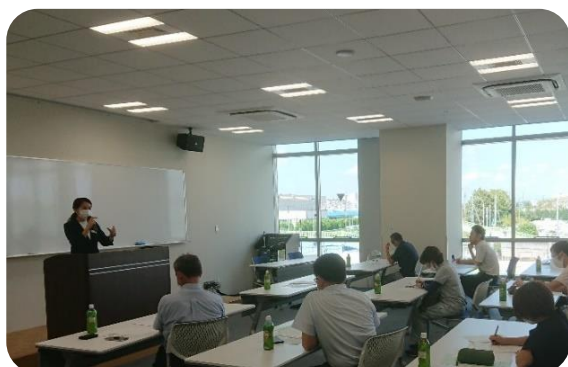
「栃木プレミアム」の品質基準等について 県より説明がありました