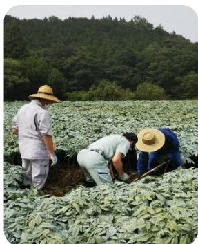
(こんにゃく芋の掘取り)

とちぎの特産物「こんにゃく」について、8月7日(金)に茂木町・鹿沼市の2圃場にて、今年度第1回目の作況調査を行いました。