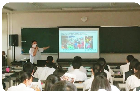
写真を交えた授業の様子 生徒の皆さんの関心も高かったようです