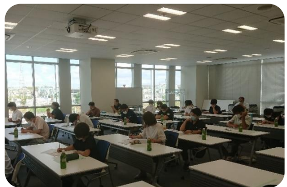
説明会に熱心に聞き入る関係者 この説明より認証制度がスタートします