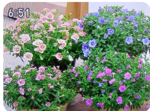
8/28 カブラコア 川村 一徳氏 (日光市)