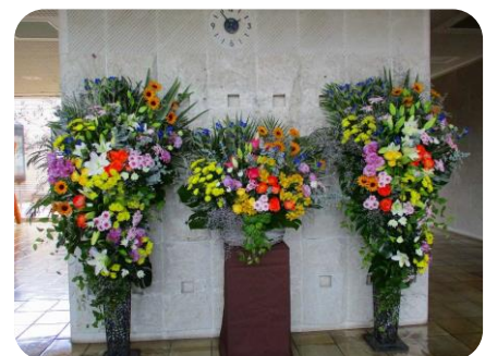
(塩谷南那須庁舎への花飾り)