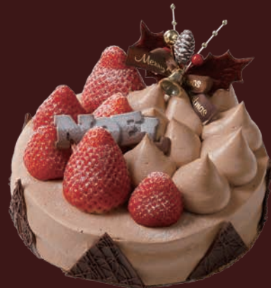
Noël fraise noir ノエルフリーズノワール