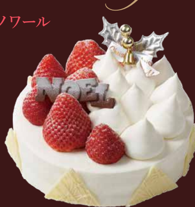
Noël fraise blanc ノエルフリーズブラン

いちご王国栃木のブランドいちご“ベリー大きい”“ベリーきれい”“ベリーおいしい”「スカイベリー」(栃木県鹿沼市「ベリーズファン」)と宮城県山元町のいちご「にこにこベリー」、2種のいちごを贅沢にデコレーションしました。ふわふわスポンジと上品な甘さのクリーム、甘酸っぱいいちごをお楽しみいただけるノエルフリーズブラン、ショコラクリーム、ショコラスポンジとショコラの豊かな味わいと華やかないちごの味わいをご堪能いただけるノエルフリーズノワール、2種のクリスマスケーキをご用意しました。