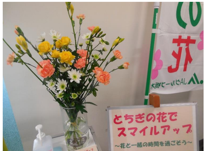
(1/25～ フリージア、SP バラ、SP マム等)