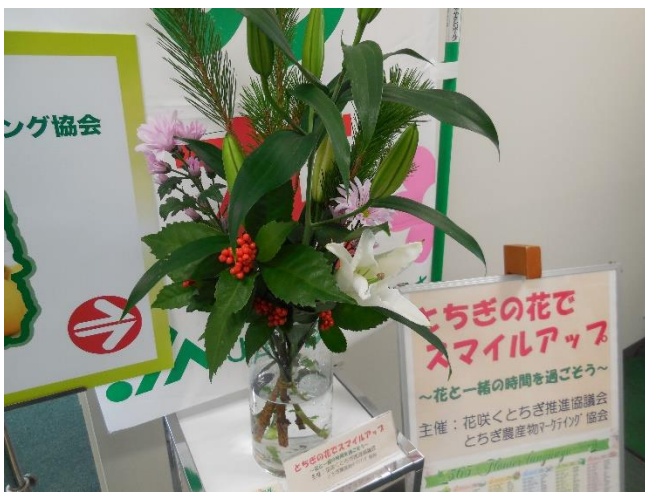
(1/4～ SP マム、HB 刈等)

こうした状況ではありますが、とにかく今できることに努め、1日も早く新型コロナウイルスの感染拡大が終息するとともに経済活動も活性化し、花をもっと楽しめることを願っています。