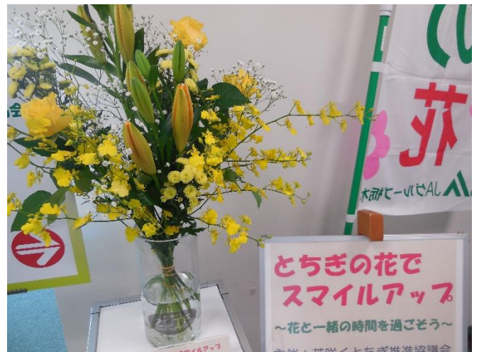
(1/12～ バラ、LA 刈等)