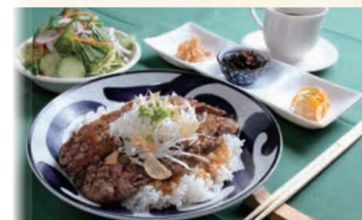
ステーキ&ワイン 存じやす