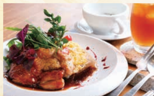
OHYA FUN TABLE