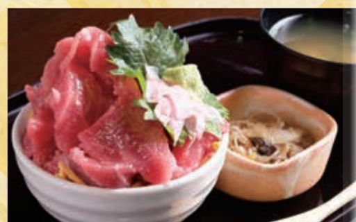
本気家源天 道の駅しもつけ店