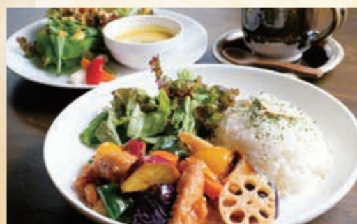
café Mario ~休みの国~