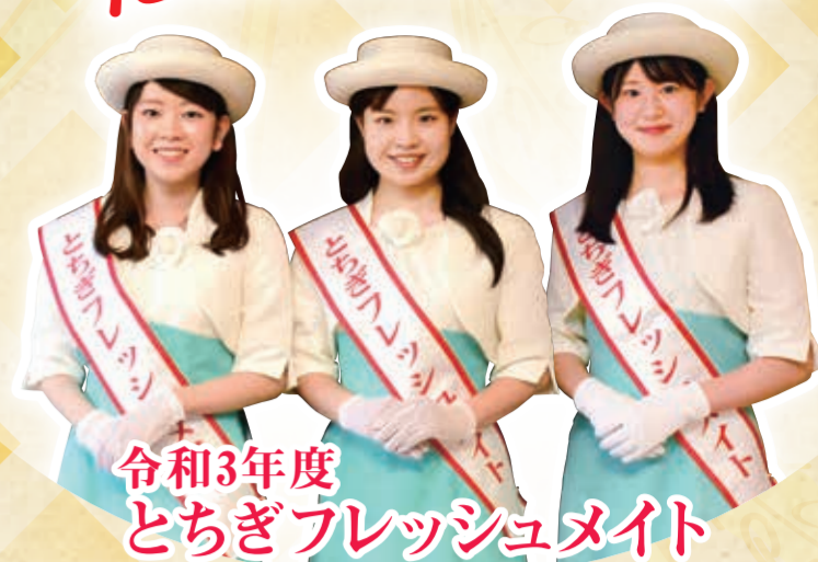
令和3年度 とちぎフレッシュメイト