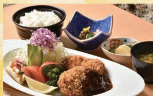
肉のふきあげ 栃木本店