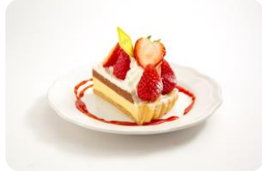
■ラ・メゾン・アンソレイユ テーブル