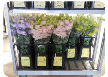
集荷されたトルコギキョウ