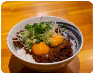
「とちぎの星」肉味噌ラー油飯