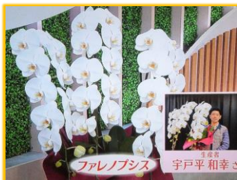
1/7 ファレノプシス 宇土平 和幸氏(下野市)

～毎週金曜日 NHK総合テレビ～「ちょこトチ！」(11:50～54)、「とちぎ630」(18:30～)