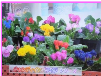
1/28 プリムラジュリアン 上野 仁氏(小山市)