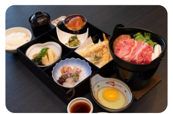
天ぶらととちぎ和牛のすきやき御膳