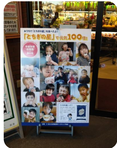
オータニ 一の沢店