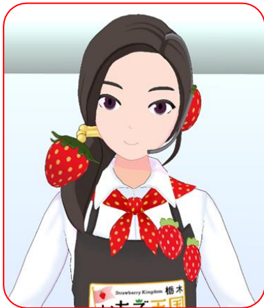
オリジナルアバター【栃おとめ】

県外の消費者に対し県産いちごの魅力を発信するため、アバター活用型PRシステムを使い、県外の百貨店・量販店で、「とちあいか」をはじめとする県産いちごのPR及び販売促進を実施しました。