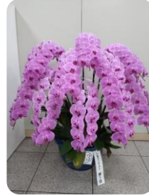
人気投票第1位 胡蝶蘭

今回は特別展示品から、観覧したお客様が選ぶ“これが1番!”の人気コンテストをあわせて行いました。投票総数は450票で、一番人気は胡蝶蘭(ピンクキャンディー)、2位はシンビジウムでした。