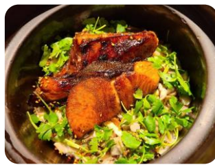
鱈の照り焼き土鍋ご飯