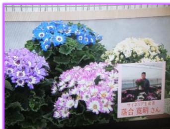
1/14 サイネリア 落合 寛明氏(栃木市)