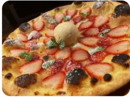
■セガフレードザネッティ エスプレッソ

※当フェアは、栃木県の花きも展示する、「第70回関東東海花の展覧会」(1/28～30)開催との連携企画として実施予定でしたが、新型コロナウイルスの感染拡大に伴い展覧会は中止となったので、単独で開催しました。