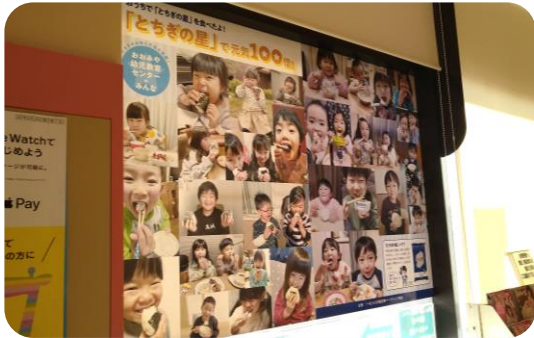
ヨークベニマル 平柳店

上記開催園園児対象に、家庭で「とちぎの星」を食べている様子の写真を応募すると、県産米3銘柄食べ比べセットが当たるプレゼントキャンペーン