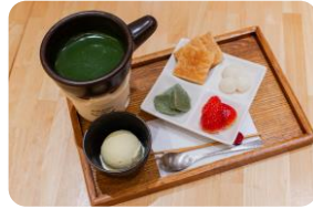
■茶鍋カフェ サリヨウ