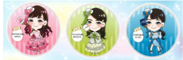
とちぎフレッシュメイト 県産米3銘柄キャラクター