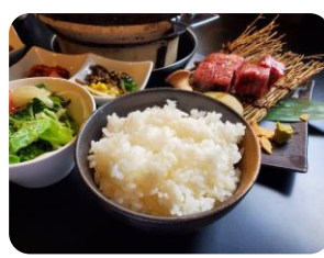
「とちぎの星」白ごはん