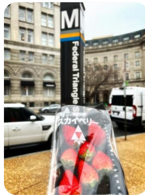
政府機関が集まるエリア Federal Triangle駅の前にて

今回の輸出が本県のいちご輸出拡大に向けたモデルケースとなるよう、当協会は生産者と輸出入事業者等をつなぐパイプ役として支援して参ります。