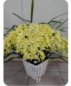
第2位 シンビジウム