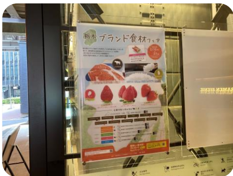
入口有楽町側看板

コロナのまん延防止等重点措置期間中の開催となりましたが、参加店から、「栃木県産いちごの良さを知ることが出来ました。お客様にも大変好評でした。」との声がありました。また、フェア終了後も県産食材を利用していただく店舗もあり、継続的な利用に繋がりました。