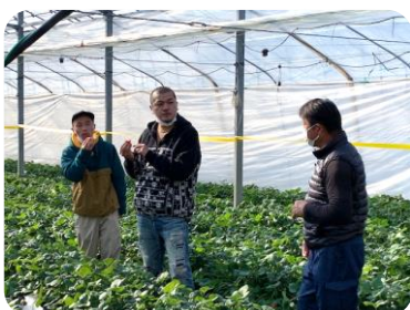
いちごの説明をする荻田部会長