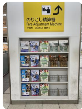
近鉄大阪難波パンフレットラック