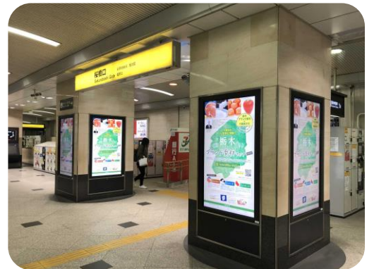
JR大阪駅桜橋口セット3