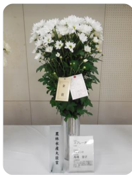
農林水産大臣賞 スプレーぎく 高橋 里子氏 (真岡市)