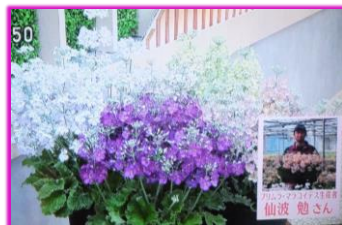
2/4 プリムラマラコイデス 仙波 勉氏 (真岡市)

2月は、優しい色合いにふんわりした草姿で花持ちのよいプリムラマラコイデス、柔らかい白の花弁とピンクのリップのグラデーションが美しく、透き通るように可愛らしいシンビジウム、色は鮮やかで多種多様、花持ちも良く蕾が次々と開いて長い期間楽しめるLAユリ、色が豊富で冬から春にかけて明るく元気な花を次々と咲かせるサイネリアの4種類の県産花きをご紹介します。