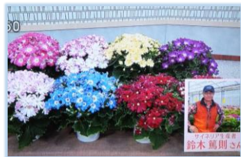
2/25 サイネリア 鈴木 篤則氏 (大田原市)