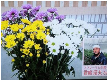
4/1 スプレーム 君嶋 靖夫氏（塩谷町）