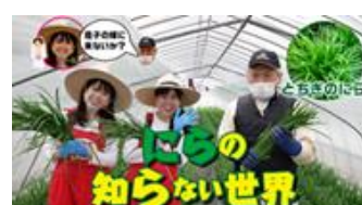
# 16 栄養満点!!「とちぎのにら」の知らない世界