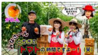
# 15 みなさん「とちぎのトマトの時間ですよ〜！」