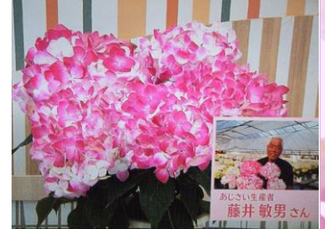
4/22 あじさい 藤井 敏男氏（小山市）