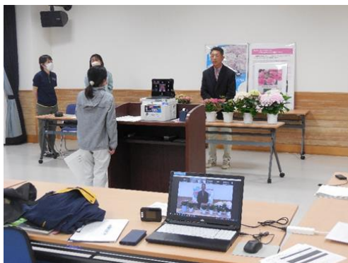
オンライン説明会の実施風景