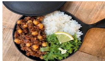
店名：biocafe ape ビオカフェアーペ とちぎ和牛で作ったチリコンカーンライス 800円（税込）