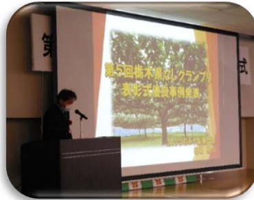
相場さんより栽培管理や経営の特徴について お話をいただきました。