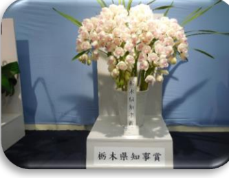
(栃木県知事賞のシンビジウム)