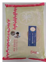
ECサイト 専用パッケージ