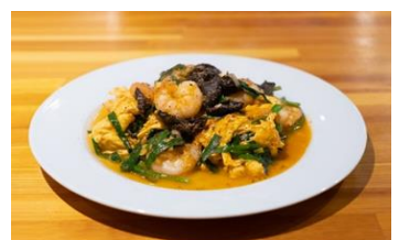
店名：創作ダイニング りとむ とちぎ和牛とトマトのロースト にらのソース 2,145（税込）