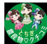
LINE公式アカウント ロゴマーク