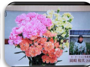
1/27 カーネーション 岡崎 和夫氏 (足利市)