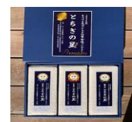
三冠ギフトセット