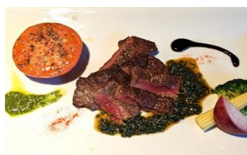
店名：デンシンランラン 栃木県産 にらとトマトのチリソース 1,320円（税込）