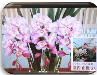
1/6 シンビジウム 隅内 正俊氏 (上三川町)