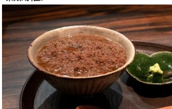
店名：梅田お初天神 大人の神戸牛焼肉 「とちぎの星」和牛お茶漬 ※ディナーコース内8,500円～（税込）で提供