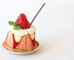
店名：ル パティシエ タカギ エリゼ 756円（税込）