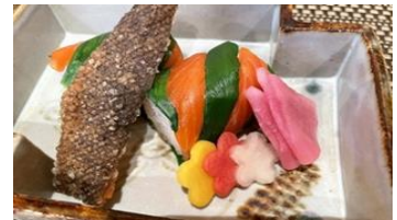
店名：割烹 船生 プレミアムヤシオマスと鹿沼にらの手廻り寿司 ※ディナーコース内¥7,500（税込）、¥8,500（税込）で提供