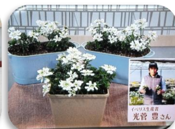
1/20 イペリス 光菅 豊氏 (真岡市)