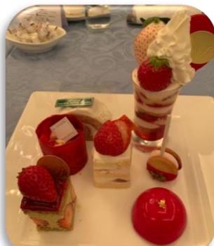
いちご尽くしのデザート盛り合わせ