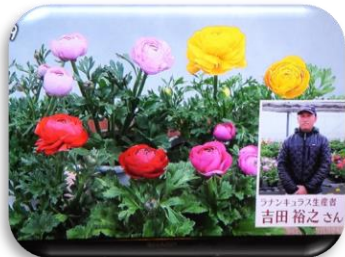
2/24 ランキユラス 吉田 裕之氏（宇都宮市）