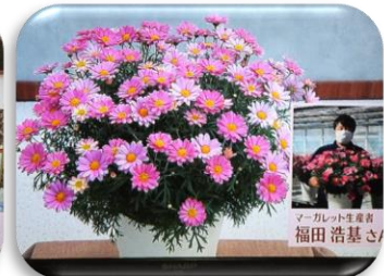
2/10 マーガレット 福田 浩基氏（日光市）