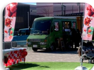
キッチンカー販売の様子