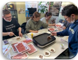
食肉卸業者渡清様視察の様子