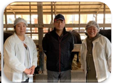
とちぎ和牛視察の様子