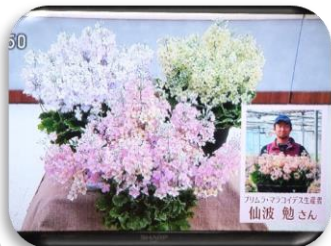
2/17 プリムラマラコイデス 仙波 勉氏（真岡市）