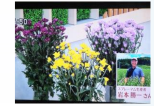
7/28 スプレーマム 岩本 勝一氏(市貝町)

令和5年8月に紹介する県産花きは、以下のとおりです。 8/4(金) 輪菊 那須地区 18(金) ユリ 上都賀地区 25(金) ひまわり 芳賀地区