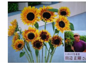
7/21 ひまわり 田辺 正剛氏(壬生町)