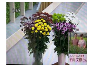
7/7 スプレーマム 平山 文修氏(那須町)

○NHK総合テレビ 毎週金曜日「ちよこち！」（総合テレビ 11:50～54）、「とちぎ630」（18:30～）