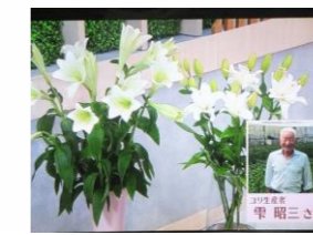
7/14 ユリ 雫 昭三氏 (那須烏山市)