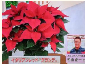
11/24 ポインセチア 杉山 正一氏(下野市)