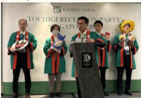
PRイベントの様子 (シンガポール)

シンガポールのレストランで行われた農産物PRイベントでは、とちぎ和牛のステーキ、とちぎの星を使用した寿司、にっこのデザートなどを提供し、招待者の皆様から高い評価をいただきました。