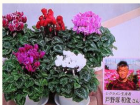
11/17 シクラメン 戸野塚 和俊氏(小山市)