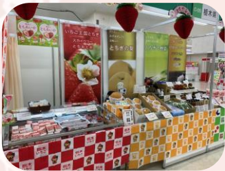
フレッシュメイト による試食PR

11月10日(金)・11日(土)、東京都サンシャインシティワールドインポートマートビルにて、令和5年度(第62回)農林水産祭「実りのフェスティバル」が開催されました。当協会は、農業に対する消費者の理解促進と県産農産物の消費拡大を目的に、新品種いちご「とちあいか」をはじめ、「にっこり」や地域ブランド農産物「ひめきゅうり」「那須の白美人ねぎ」、オリジナル品種県産米「とちぎの星」及びいちご・梨の加工品等の試食販売を行いました。