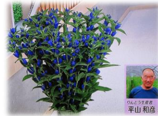
6/28 りんどう 平山 和彦氏(那須町)