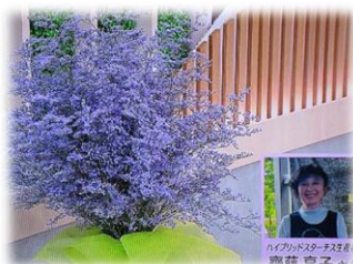
6/7 ハイブリッドスターチス 齋藤 享子氏(さくら市)

6月は、薄紫の小さく可愛い花が初夏を涼しく彩ってくれるハイブリッドスターチス、大輪で白・淡いピンク・淡いグリーンの花弁が気高く美しいトルコギキョウ、濃い青紫が初夏の爽やかさを醸し出すりんどう、3品目の花を紹介しました。