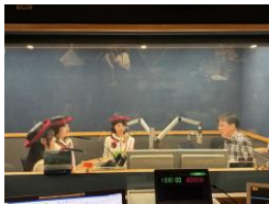
ラジオ生出演（CRT栃木放送・レディオベリーFM栃木）