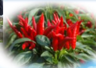
出荷時期（1月～3月） の「赤いとうがらし」