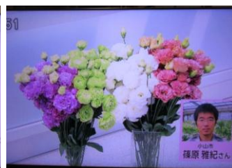
6/12 トルコギキョウ 篠原 雅紀氏（小山市）