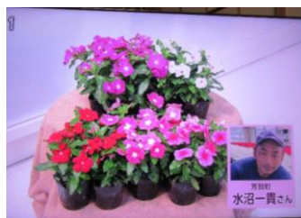
6/5 ニチニチソウ 水沼 一貴氏（芳賀町）