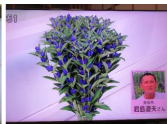
6/26 りんどう 君島 道夫氏（矢板市）