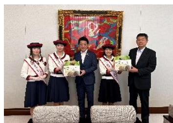
栃木県議会関谷議長・白石副議長訪問