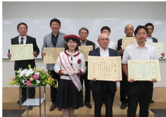
表彰された生産者の皆さん