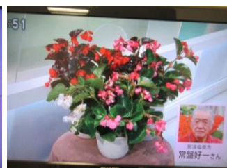
6/19 ペゴニア 常盤 好一氏（那須塩原市）