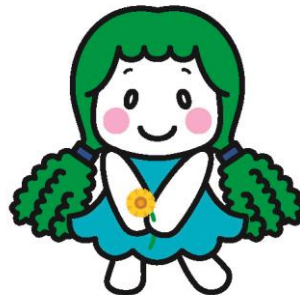
キャラクター名：はるなちゃん