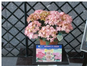
ジュエリーポップ