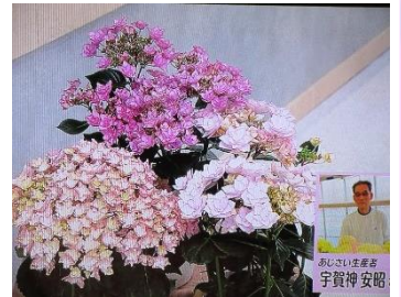
4/26 あじさい 宇賀神 安昭氏 (鹿沼市)