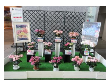
栃木県が開発したあじさい7品種)