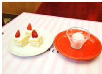
ショートケーキ&ミルクゼラー