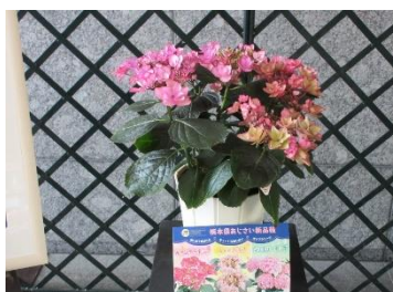
キャンディーポップ