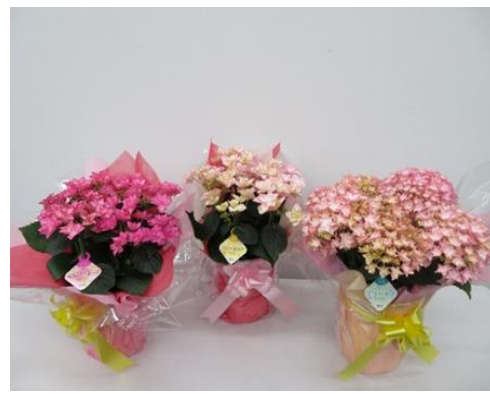
各生産者が持ち寄ったあじさい・意見交換