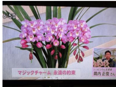
1/10 シンビジウム 隅内 正俊氏（上三川町）