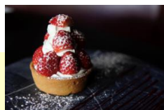
「両国レガート」 ❁ 北海道産プラータチーズと栃木県産いちご、有機栽培香トマトのマリネ添え