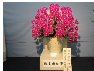
栃木県知事賞のファレノプシス