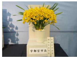
宇都宮市長賞のシンビジウム