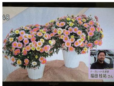
2/28 マーガレット 福田 佳祐氏(日光市)