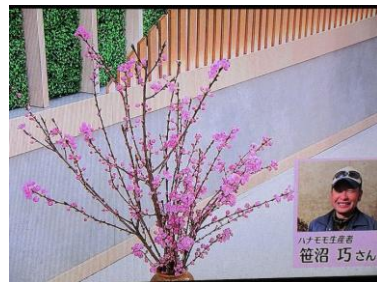
2/14 ハナモモ 笹沼 巧氏(那珂川町)