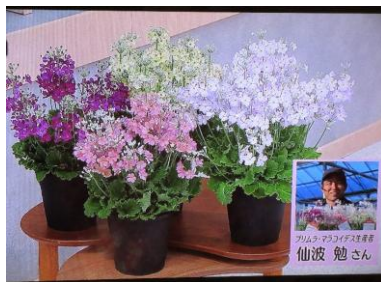
2/7 プリムラ・マラコイデス 仙波 勉氏(真岡市)