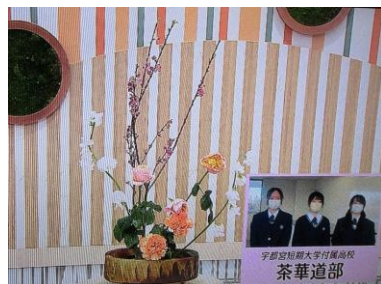
2/21 アレンジメント 茶華道部 (宇都宮短期大学付属高校)