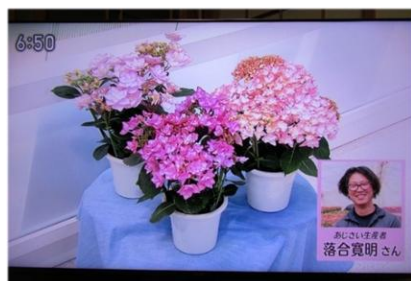
5/2 あじさい 落合 寛明氏（栃木市）