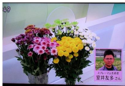
5/30 スプレーマム 室井 友多氏（那須町）