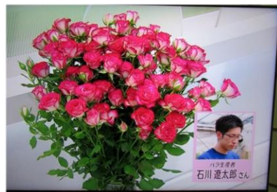
5/16 バラ 石川 遼太郎氏（宇都宮市）