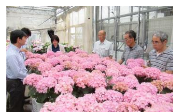
出荷反省会後の情報交換